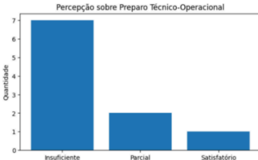
Gráfico 3 - Percepção sobre preparo técnico-operacional