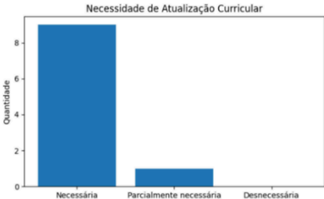
Gráfico 4 – Necessidade de atualização curricular voltada ao atendimento inclusivo

Os dados demonstram elevado nível de concordância acerca da necessidade de modernização curricular da formação policial contemporânea, especialmente diante das demandas contemporâneas de proteção de grupos vulneráveis e gerenciamento de ocorrências complexas.