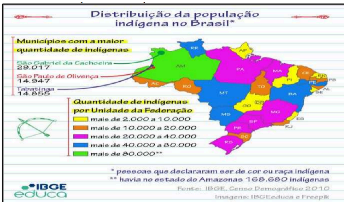
FIGURA 1: DISTRIBUIÇÃO DA POPULAÇÃO INDÍGENA NO BRASIL