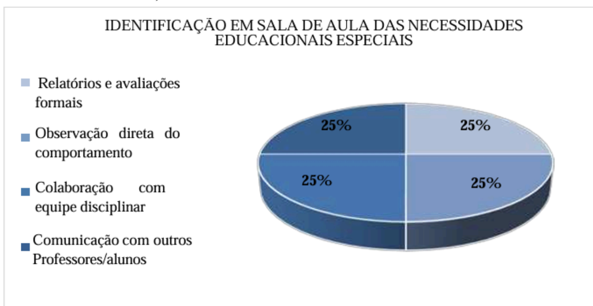
GRÁFICO 1 - IDENTIFICAÇÃO EM SALA DE AULA DAS NECESSIDADES EDUCACIONAIS ESPECIAIS