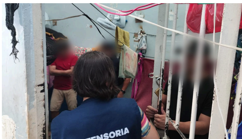
Imagem 2: Delegacia em Tonantins/AM.

Nota-se que a situação dos municípios do interior tende a se assemelhar, como no caso da cidade de Benjamin Constant. Conforme noticiado pelo site G1 (2025), durante inspeção realizada pelo defensor público Renan Nóbrega, em 2025,