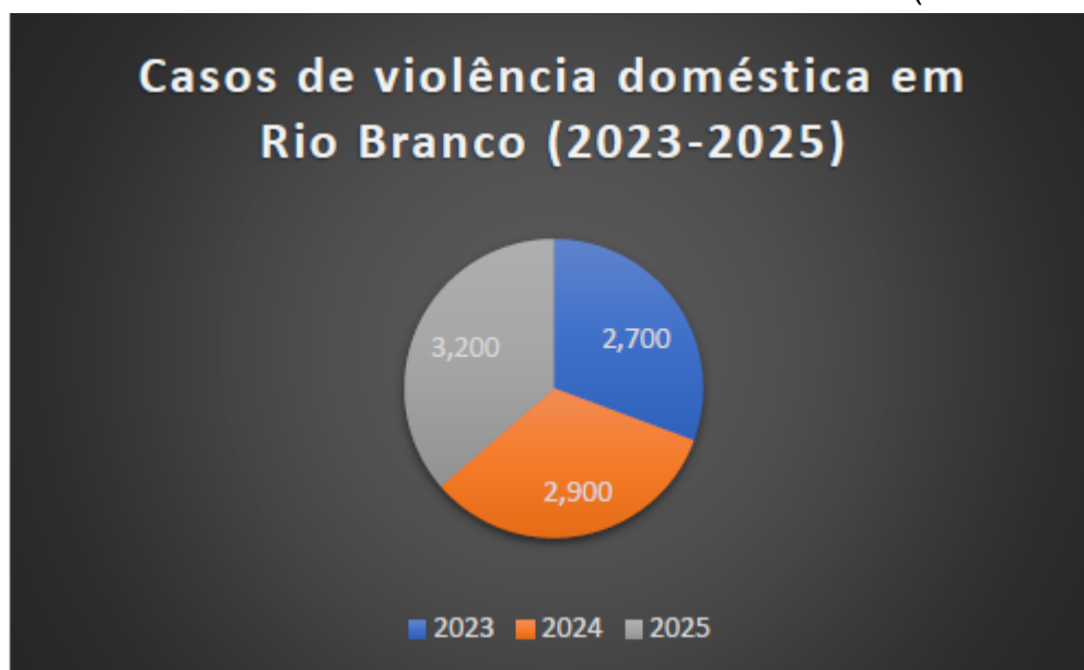
Gráfico 2 – Casos de violência doméstica em Rio Branco (2023-2025)